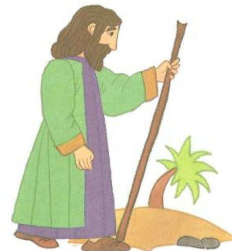
Maria, Jozef en Jezus gingen naar Egypte. Daar waren ze veilig.