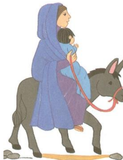
Een engel zei tegen Jozef: „Ga naar Egypte. Daar kunnen de soldaten Jezus niet vinden.”