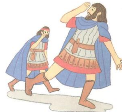
De koning had soldaten. Ze gingen Jezus zoeken. Dat moest van de koning.