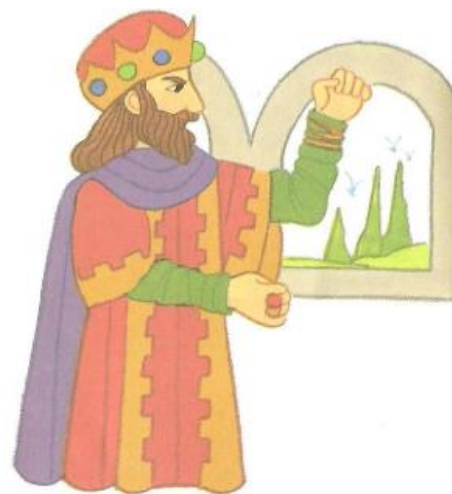
Er was een boze koning. Hij heette Herodes. Hij wilde Jezus dood maken.