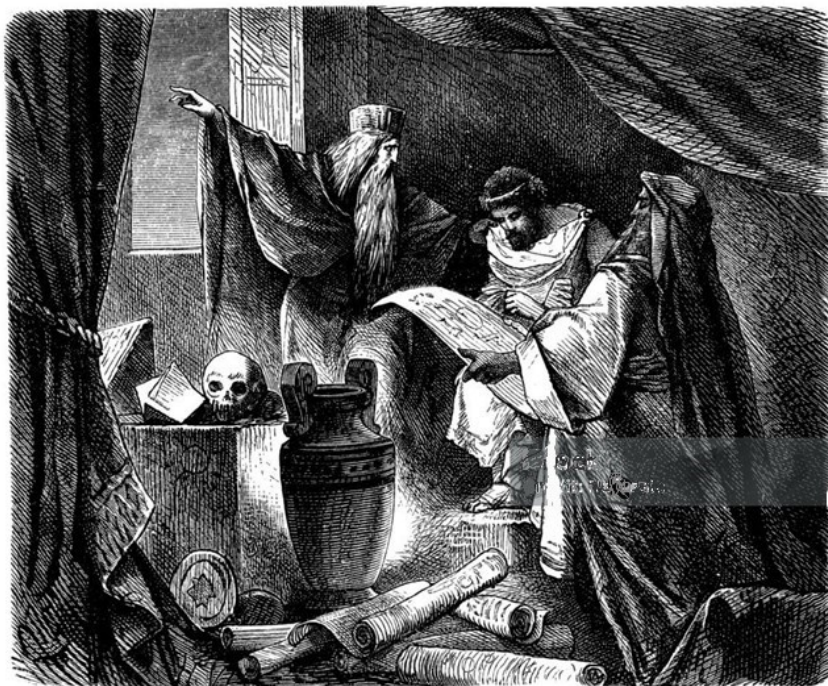
De wijzen uit het oosten