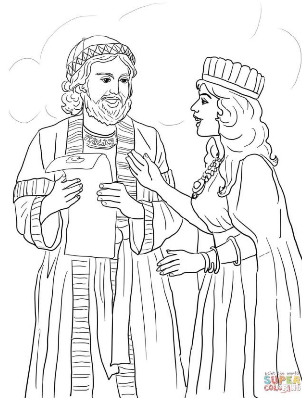
Mordechai is een oom van Koningin Esther

Kun jij deze naam ook schrijven? Mordechai: