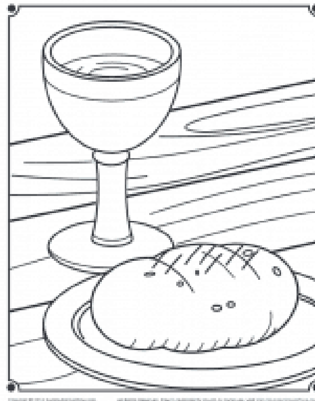
brood & wijn

Volgende week zondag vieren we in de kerk het Heilig Avondmaal.