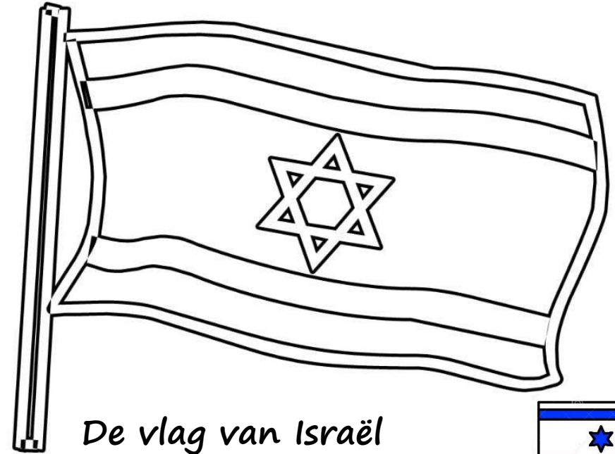
De vlag van Israël

die op de Heere vertrouwt, is veilig zoals een berg stevig staat en niet zomaar omvalt, zo zal het zijn met die op de Heere vertrouwt