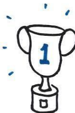
-b r = n