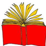
b = z