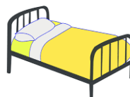
d = t